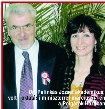
Dr. Pálincás József akadémikus, volt oktatási miniszterrel március 15-én a Polgárok Házában