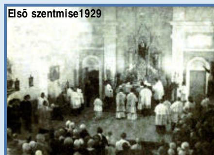
Első szentmise 1929

A Notre Dame Női Kanonok- és Tanítórend 1929-ben kezdte meg a városban az oktató- és nevelő munkát. Egészen a szét-szórátásig végezte áldásos működését, majd a több mint 40 éves kényszerszünet után