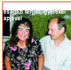
es igazai ferjével, gyerekei apjával