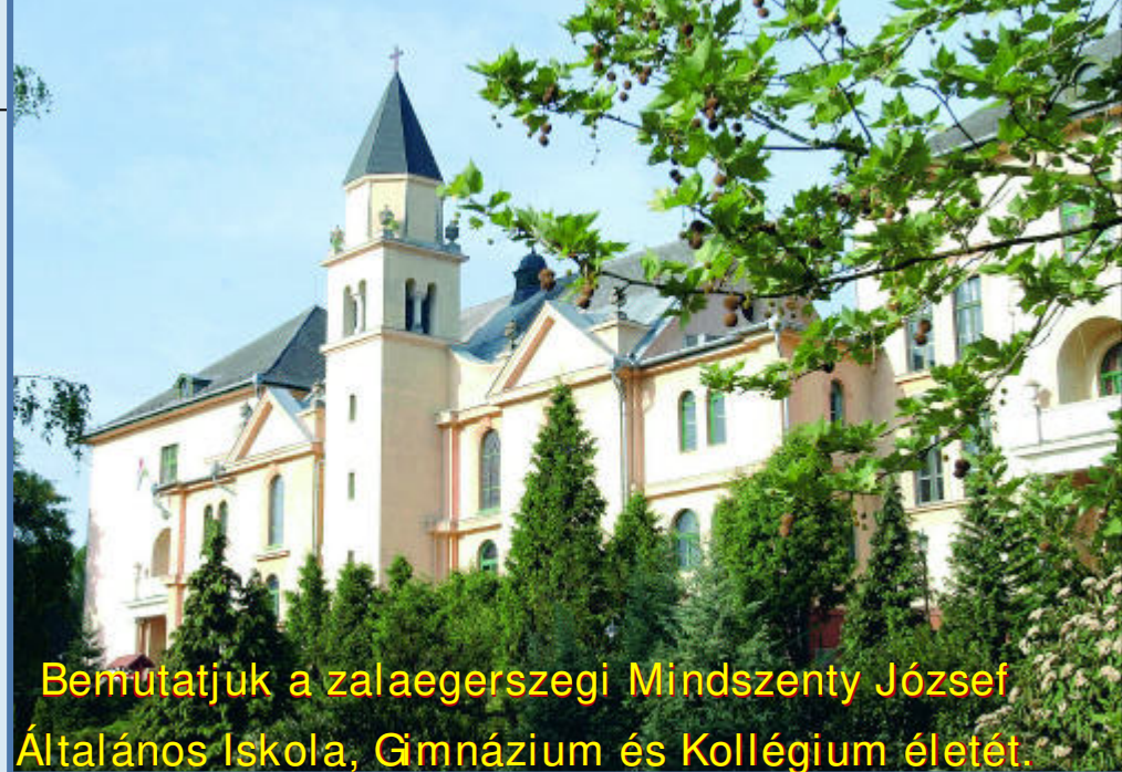
Bemutatjuk a zalaegerszegi Mindszenty József Általános Iskola, Gimnázium és Kollégium életét.

tette, emellett több templomot, plébániaépületet és iskolát köszönhet neki a város.