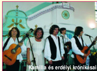
Kamilla és erdélyi krónikásai