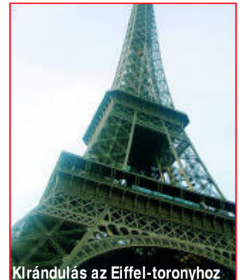
Kirándulás az Eiffel-toronyhoz