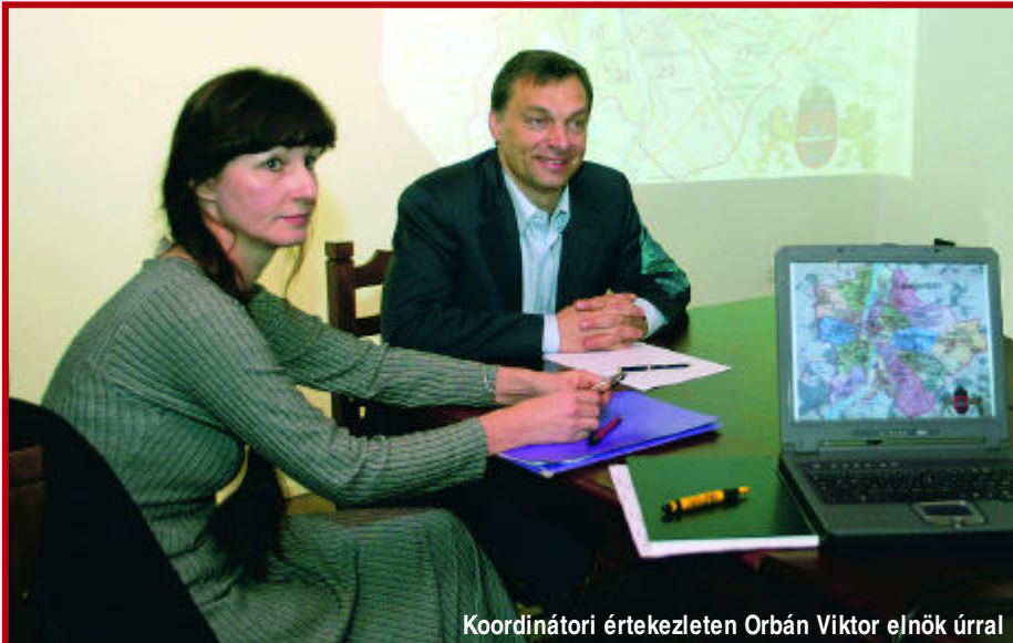
Koordinátori értekezleten Orbán Viktor elnök úrral