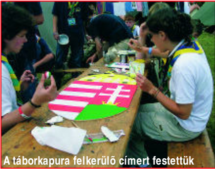
A táborkapura felkerülő címert festettük

szájjal írtunk – nagyon érdekesnek és tanulságosnak találtam. Az Adrian see nevű helyen is jártunk, ahol szintén nemzetek mutatkoztak be. Egyik este meghívtuk az angolokat vacsorára. Nagyon jól beszélgettünk velük. Egyik délelőtt „Celebrate Europe” volt. Előtte mindenki kapott egy „Celebrate Europe” feliratú fehér nyakkendőt meg egy tollat, és amikor mindenki együtt volt, aláírtuk egymásnak. Az enyémen is van spanyol, angol, lengyel, portugál, olasz, görög és még sok más cserkész kézírása! Aztán nemzetek napja/étele volt, ami annyiból állt, hogy minden ország a saját táborhelyén elkészítette jellegzetes ételét és a külföldiek pedig jöttek és kóstoltak mindentől, ami ízlett nekik. A mi táborunkban gulyásleves és pörköltet főztünk. Néhányan, köztük én is (2 lány, 2 fiú), népviseletbe öltöztünk, és így jártuk az „utcákat”, külföldieket hívogatva, hogy jöjjenek és próbálják ki a magyar ételeket is! Sikerünk volt és az étel is ízlett! Egész napos kiránduláson is jártunk a Gilwell parkban, amely a világ legnagyobb cserkészparkja. Rengeteg dolgot csinálhattunk: falat