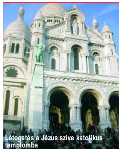
Látogatás a Jézus szíve katolikus templomba