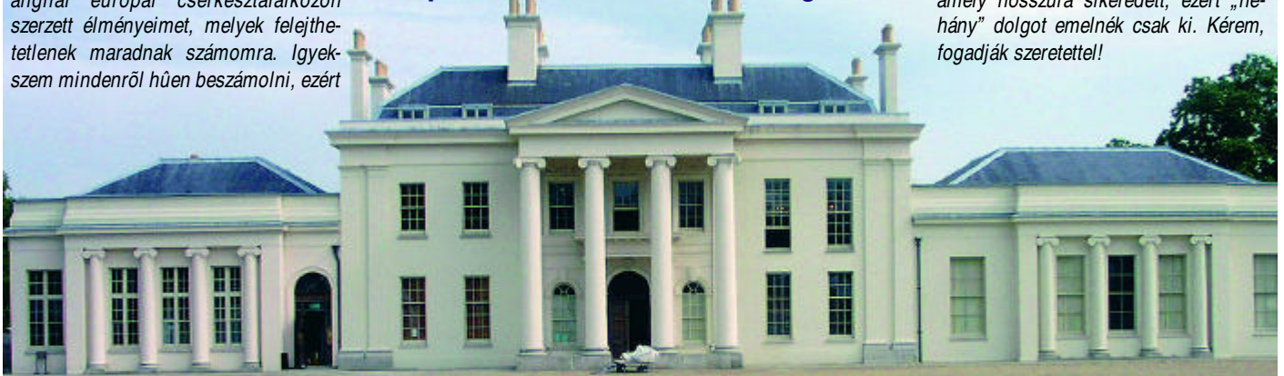
A kastély, melynek parkjában volt az egész tábor

vezettem az egész út során naplót, amely hosszúra sikeredett, ezért „néhány” dolgot emelnék csak ki. Kérem, fogadják szeretettel!