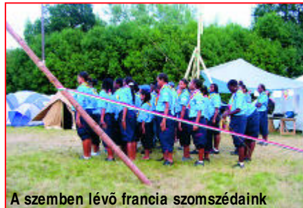
A szemben lévő francia szomszédaink

és sziklát másztunk, ugráltunk 8 méter magasból, akadályparkon mentünk végig, csúsztunk, másztunk, bicikliztünk, szánkóztunk a fűvön, gokartoztunk, fürödtünk... Az elmúlt napokban cseréltem egy török, egy portugál, két kuwaiti nyakkendőt és egy spanyol, valamint egy egyiptomi pólót, nagyon örültem nekik! Karitatív munkát is végeztünk; lehetett választani, ki mit szeretne. A mi őrünk padot ment építeni. Kaptunk egy talicskányi eszközt, meg betont. Végül egész jól összehoztuk! Felléptünk a táncunkkal, Magyarország bemutatkozása címén. Szerintem egész nagy sikerünk volt, előttünk a mexikóiak szerepeltek, nekik nagyon tetszett! Vasárnap esténtként katolikus misén vettünk részt. Egy napon meghívtuk az íreket ebédre, minket pedig az angolok piknikre. Készítettünk palacsintát, ami nagyon ízlett nekik. Még aznap nagy focibajnokságot rendeztek a fiúk az altáboron belül. Egész jól sikerült, bekerültek a döntőbe, amit a spanyolokkal játszottak. Sajnos nem mi nyertük a saját bajnokságunkat, mert a spanyolok győztek 2:1-re. Volt karnevál is, nagyon sokan beöltöztek, nagy mulatság volt! Utolsó este nagy záróünnepség várt ránk! Levetítettek egy kisfilmet