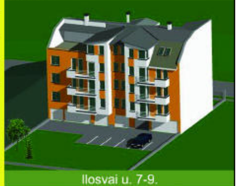
Ilosvai u. 7-9.

A lakás vételárának 50%-áig zuglói lakásokat is beszámítunk! Kérjük, tekintse meg több mint 1000 lakásból álló referenciánkat! Érdeklődni lehet: