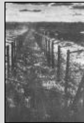
Auschwitz, 1942. VIII. 9-én vértanúságot szenvedett.

Amikor Edith a könyvet elolvasta, így summázta: „Ez az igazság!” Az ismert filozófusnő 1922-ben megkeresztelkedik, majd 1933-ban belép a kölni kármelita kolostorba. Rendje 1938-ban a hollandiai Echt kolostorába helyezi át, hogy megmentse az üldözéstől. Az SS a megkeresztelt zsidókat is deportálja. Így hurcolták el Teréz Benedikta nővért előbb az avwesterborki elosztóba, majd az auschwitzi megsemmisítő táborba. Sorsát nagy nyugalommal és bátorsággal vállalta, társait segítette és vigasztalta. Letartóztatása után egy héttel, augusztus 9-én tereltek a gázkamrába társaival együtt, 1942-ben.