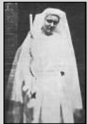
Szerzetesi beöltözése a kölni kármelbe. 1934. IV. 15.