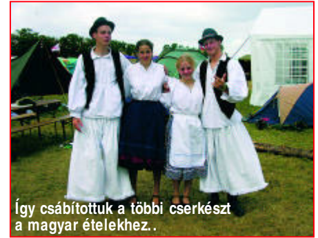
Így csábítottuk a többi cserkészt a magyar ételekhez.

az egész Eurojam-ról, aztán még néhány bemutató, zene és party! Augusztus 10-én korán reggel keltünk, maradék holmijainkat összeraktuk, sátrainkat lebontottuk, hiszen utazás haza! Jött a kamionunk, amely hazaszállította a nagyobb dolgokat. Felpakoltunk rá, majd elbúcsúztattuk néhány rajtársunkat, akik még maradtak pár napot családoknál. Én haza sajnos egy másik géppel mentem, így nem a saját rajommal utaztam, hanem egy másikkal. Nehéz volt a búcsúzkodás, de lesz még egy „after party” otthon!