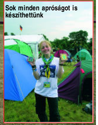
Sok minden apróságot is készíthettünk

2005. július 29-től augusztus 10-ig került megrendezésre London közelében, Chelmsfordban a Világ Cserkészszövetsége szervezésében az elmúlt tíz év legnagyobb európai cserkésztalálkozója, az Eurojam, 170 magyar cserkész részvételével. A Magyar Dzsembori Csapat 3 rajban 108 gyerekből, 17 vezetőből és 45 fiatal felnőtt segítőtől (IST) állt. A magyar kontingens felkészítése már hónapokkal ezelőtt megkezdődött: négy hétvégéből és egy előkészítő táborból állt. A felkészítés céljai a következők voltak: magyar kulturális műsor készítése, az angol kultúra megismerése, komplex személyiség-fejlesztés napi feladatok alapján: fizikai, szellemi, lelki. Az Eurojam céljai egybeestek a nemzetközi cserkészélet célkitűzéseivel. A programok mind a speciális cserkészmodszert követték, azaz a fiatalok élményszerű tanulását és fejlődését; nemzetek közötti párbeszéd, egymás kultúrájának felfedezése, globális problémák megismerése és elemzése játékos formában: környezetvédelem, emberi jogok, városnézés, kirándulás, sport. Sokat készültünk a nagy eseményre, sőt előtte a válogatásra is, hiszen nem mehetett minden cserkész az országból Angliába. Az előtábor a budapesti cserkészparkban július 25-28-ig tartott. 28-án a szokásos reggeli teendők után összepakoltunk, majd ebéd után elindultunk a Szent Imre Gimnáziumba, hogy búcsút vegyünk szüleinktől, ismerőseinktől, barátainktól a nagy nap előtt. Másnap reggel a 3 raj 3 különböző repülőgéppel utazott, a miénk de.