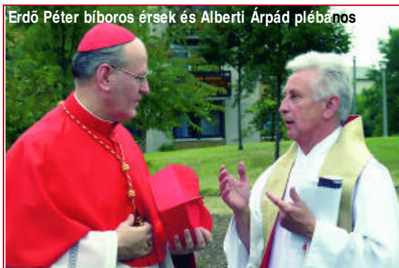
Erdő Péter bíboros érsek és Alberti Árpád plébános

Nemigen találkoztam már ezzel az egyházmegye plébániatemplomaiban. Magánkápolnában természetesen, de az egy másik helyzet. Azt hiszem itt is meg lenne a liturgikus térben az adottság, hogy egy szerény, kisméretű, a környezetbe illő szembe oltár kialakításra kerüljön. Akkor még inkább közelebb kerül a pap a hívekhez, hiszen a templom nem olyan nagy.