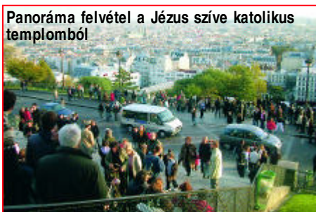
Panoráma felvétel a Jézus szíve katolikus templomból