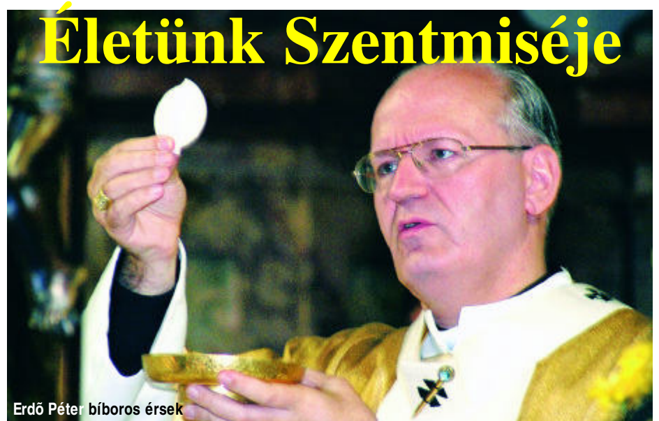
Erdő Péter bíboros érsek

Hogyan lehet összekapcsolni az életünket, a hétköznapijainkat a szentmiseáldozattal? A szentmise a valóság szeretetével kezdődik. Minden szentmisében bűnbánatot kell tartanunk. Valamennyien sebzett kapcsolatokban élünk. Mindannyian vágyakozunk a szeretet teljessége után, és egyikünkben sincs meg a szeretet teljessége, mindegyikünknek sebzetek a szeretetkapcsolatai, és minden szentmisében meg tudja gyógyítani az Úr Jézus Krisztus ezeket a sebeket. Ahhoz, hogy az a kérésünk, amit a szentáldozás előtt kimondunk, hogy: csak egy szót szólj és meggyógyulok, hogy ez megtörténjen, nekünk is együtt kell működnünk azzal, amit Isten akar nekünk adni. Az együttműködés első lépése, hogy felismerjük és beismerjük azt, hogy felelősek vagyunk azokért a sebekért, amiket kaptunk vagy adtunk másoknak. A bűnbánatban valamennyien megvalljuk, hogy rászorulunk Isten gyógyító szeretetére, rászorulunk az Ő irgalmára, és miként az utolsó vacsorán Jézus megmosta a tanítványai lábát, ami a legkoszosabb volt és a legsebzettebb az út porától, töviseitől, köveitől, ugyanúgy minden szentmisén kész megmosni a mi bűntől sebzett életünket és