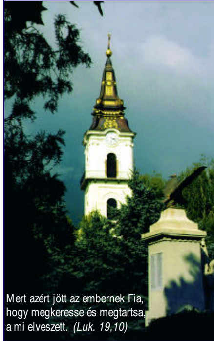
Mert azért jött az embernek Fia, hogy megkeresse és megtartsa, a mi elveszett. (Luk. 19,10)

rem, Baksay-múzeum, muzeális könyvtár, olvasóterem, lelkészi hivatal és szolgálati lakások. Az építkezést sokan kísérték érdeklődéssel és