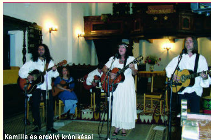
Kamilla és erdélyi krónikásai

kal, most nyolcvanötven vagyunk, hatvanan lakunk itt a kollégiumban. Amikor az iskolát megnyitottam kiderült, hogy igen sokan vannak azok a fiatalok, akik a szelíd vallásos dalokat, megzenésített verseket, régi históriás énekeket, történelmi dalokat szeretik. Elsősorban az a feladatunk, hogy a környező országokban, a kisebbségi sorsban megfáradt lelkeket