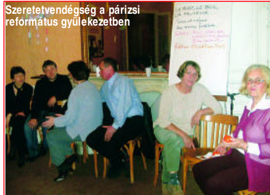
Szeretvendégység a párizsi református gyülekezetben