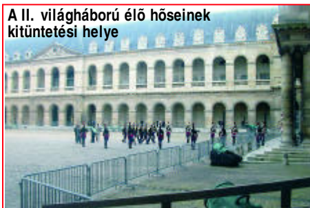
A II. világháború élő hőseinek kitüntetési helye