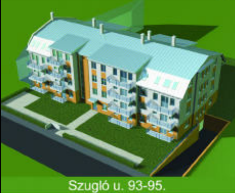
Szugló u. 93-95.

KEDVEZMÉNYES KAMATOZÁSÚ HITELLEL MEGVÁSÁROLHATÓK ZUGLÓBAN ÉS A XIII. KERÜLETBEN KÖZTISZTVISELŐK RÉSZÉRE ELŐLEG BEFIZETÉSE NÉLKÜLI 240.000 - 304.000,- Ft+ÁFA/m 2 áron