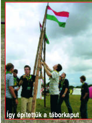
Így építettük a táborkaput