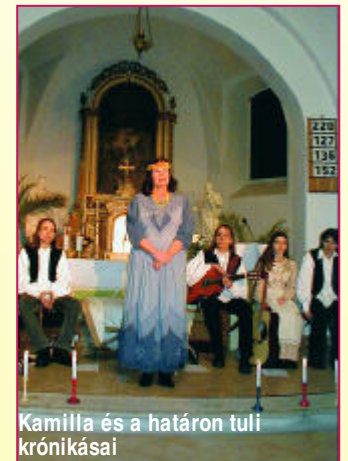
Kamilla és a határon túli krónikásai