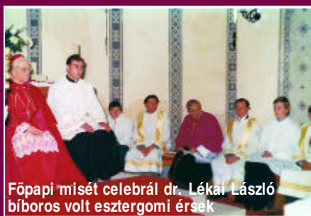
Főpapi misét celebrál dr. Lékai László bíboros volt esztergomi érsek