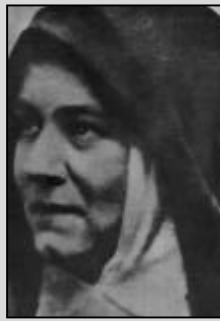
Önkéntes ápolónő az I. világháború idején (1915.)